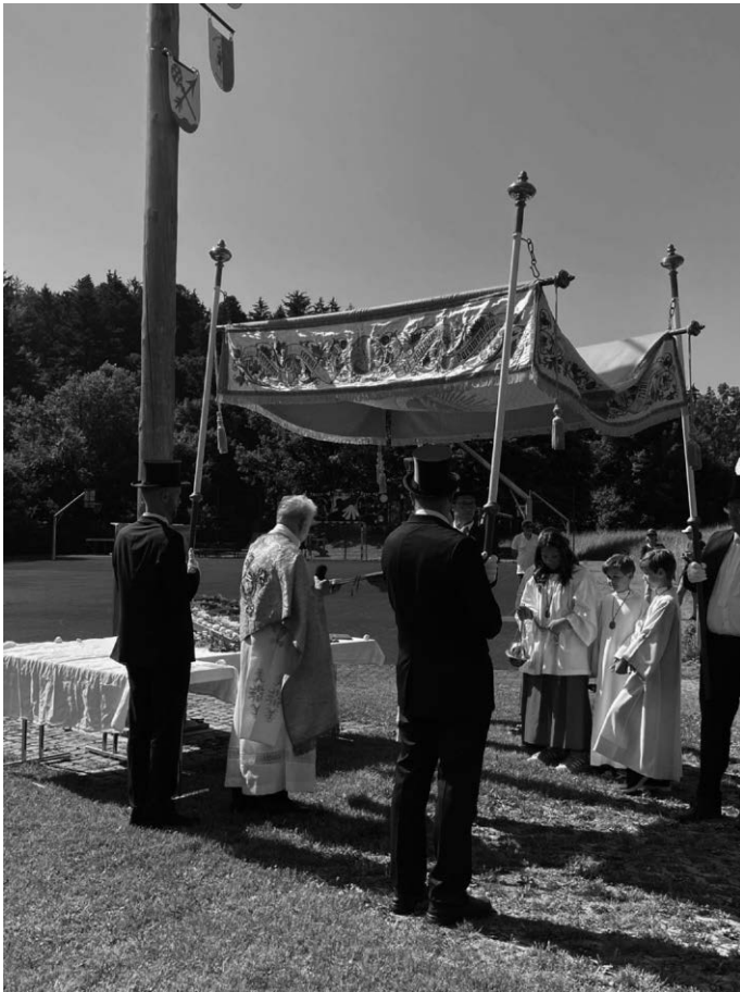
Beim Altar der Landjugend am Maibaum