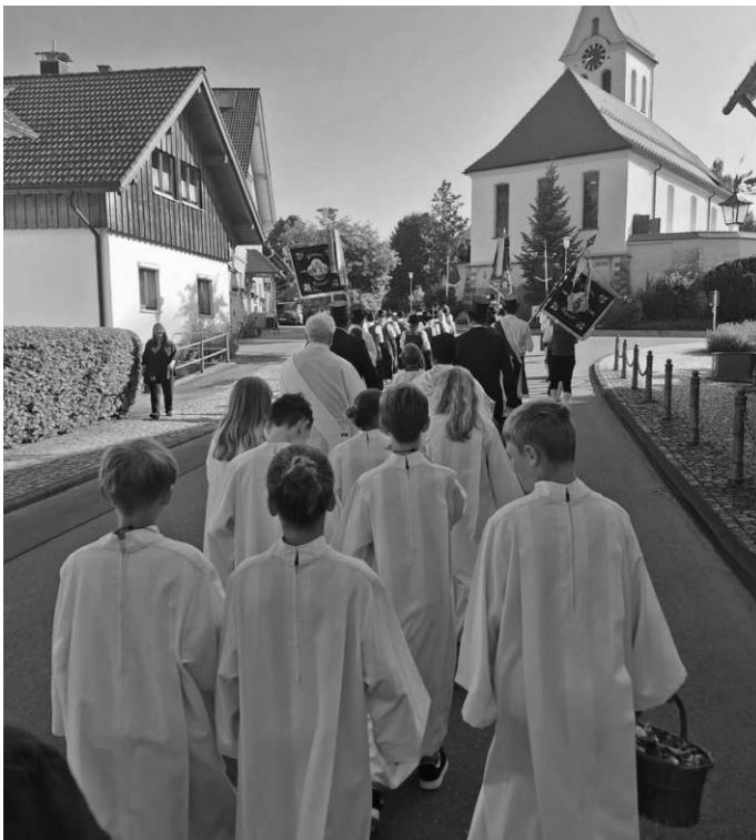
Der Festzug zieht bei traumhaften Wetter durch Karsee