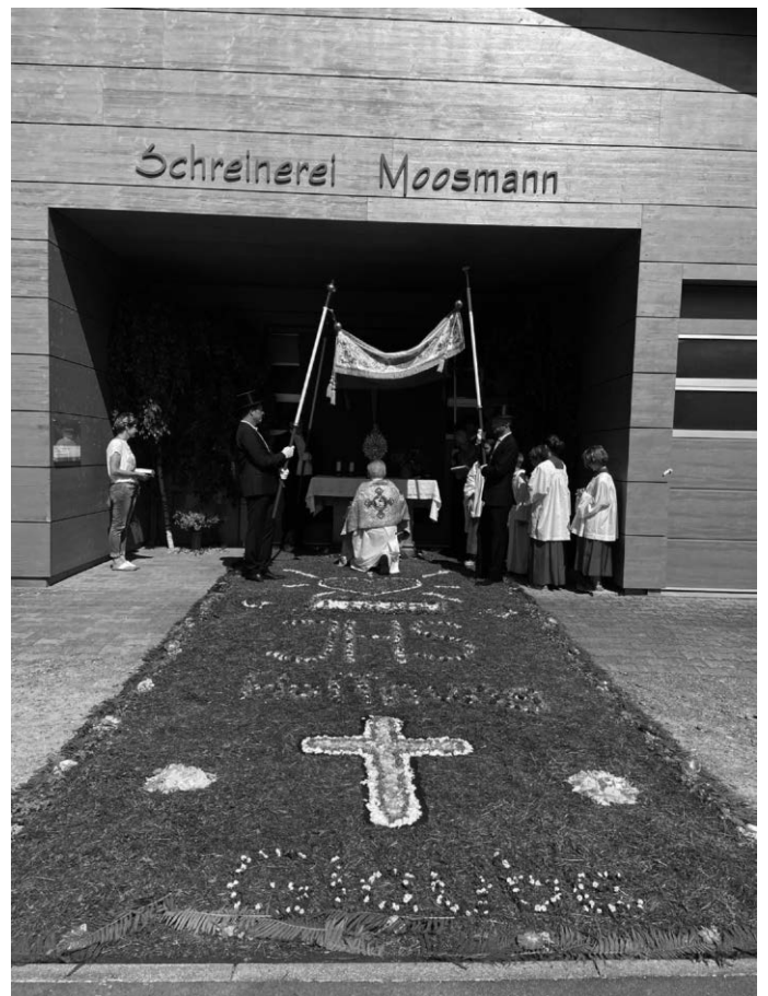
Einfach riesig: der eindrucksvolle Blumentepich des KGR und vielen weiteren fleißigen Helfern

Mit einem festlichen Gottesdienst mit Pater Jordin und Diakon Rosenthal feierten die Gemeinden Karsee und Leupolz gemeinsam das Hochfest Fronleichnam. Im Anschluss an den Gottesdienst zog, bei herrlichem Sommerwetter, die Festgemeinden, begleitet von der Musikkapelle Karsee und den Kommunionkindern, in einer feierlichen Prozession durch das Dorf. Einen ganz herzlichen Dank an alle Musiker und Musikerinnen, Fahnenträger und an all die fleißigen Helfer und Helferinnen, die mit viel Geduld die wunderschönen Blumentepiche gelegt und Ihre