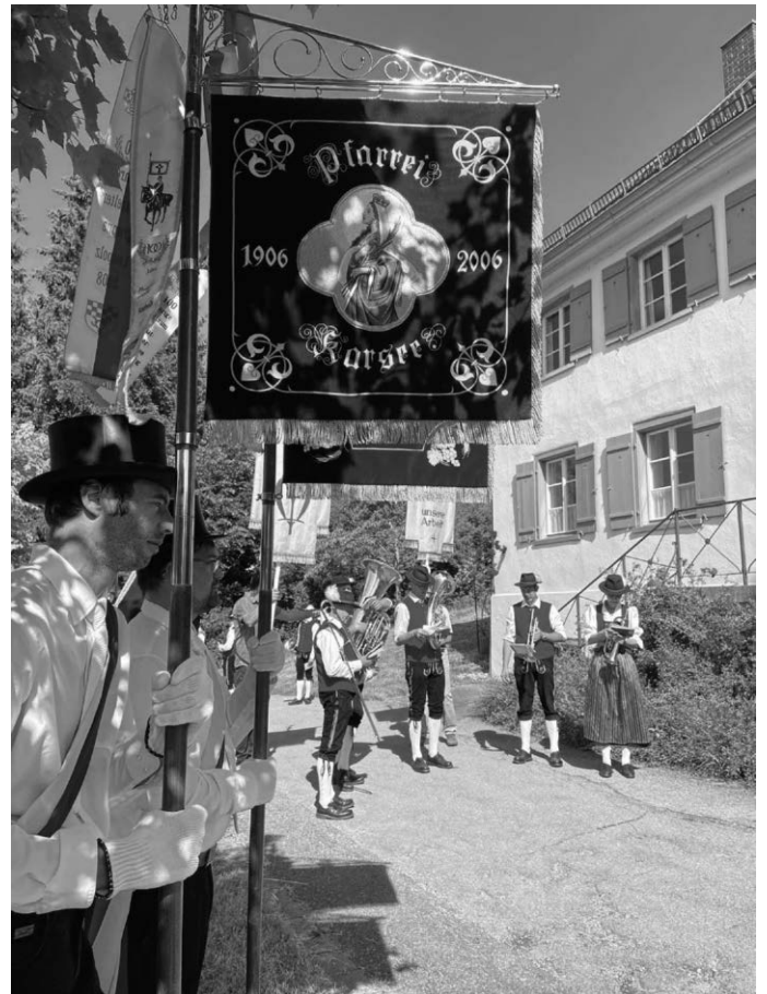
Dürfen bei Fronleichnam nicht fehlen: Musikkapelle und Fahnenabordnungen