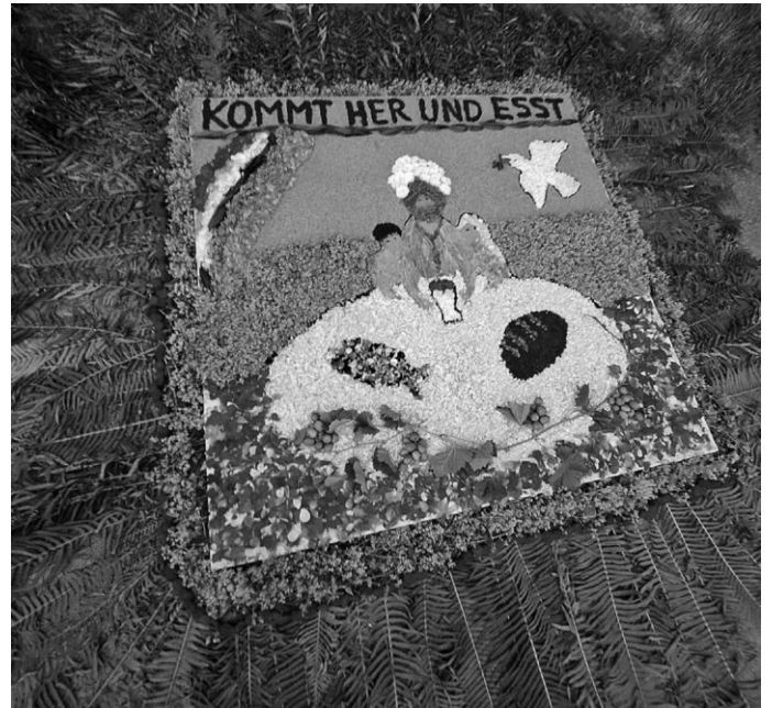
Wunderschön: der Blumentepich der Kommunionkinder mit Ihrem Motto „Kommt her und esst“