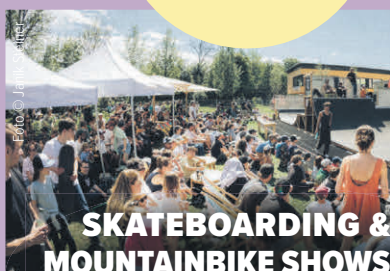
SKATEBOARDING & MOUNTAINBIKE SHOWS