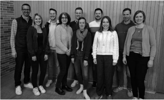
Das Bild zeigt den neu gewählten Ausschuss des Musikvereins.

Bevor die Versammlung geschlossen wurde, gab es noch einen Ausblick auf die kommende Saison 2025 des Musikvereins, welche wieder einige Highlights bereit hält.