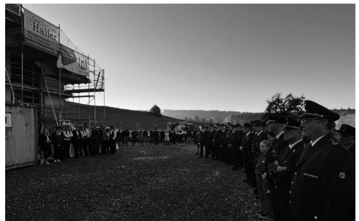
Richtfest Feuerwehrhaus, Am 28.10.

Im Frühjahr begann der Bau des neuen gemeinsamen Feuerwehrhauses und am 28.10. konnte das Richtfest unter großer Beteiligung der Feuerwehr gefeiert werden.