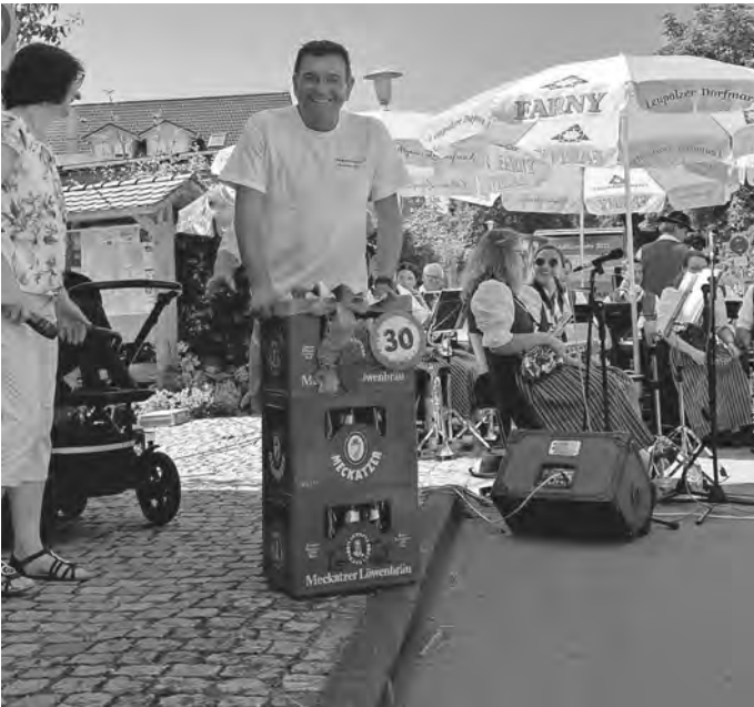
Die Ortschaft gratuliert mit 30 Liter Bier zum 30jährigen Jubiläum