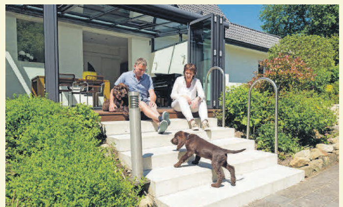
Mehr Wohnraum und mehr Lebensqualität: Der gläserne Anbau hat das Haus aus den 1950er-Jahren deutlich aufgewertet.

WAGNER Druck + Verlag Druck + Verlag Wagner GmbH & Co. KG Max-Planck-Straße 14 | 70806 Kornwestheim